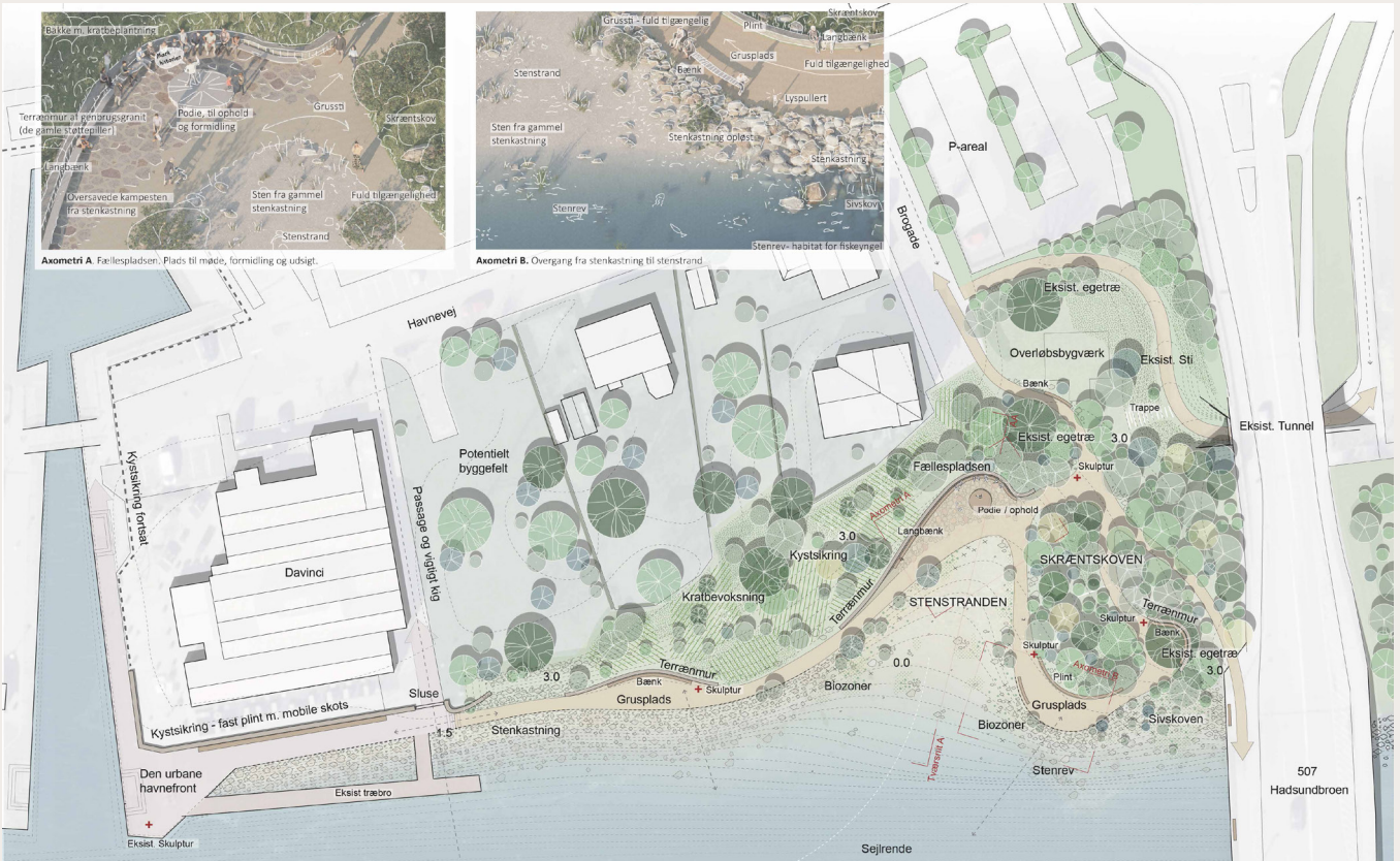
Situationsplan fra vinderforslaget