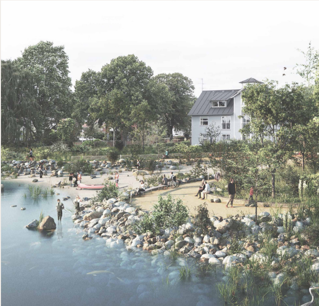
Forslag - 19172 (Vinderforslag) lavet af Bara Land