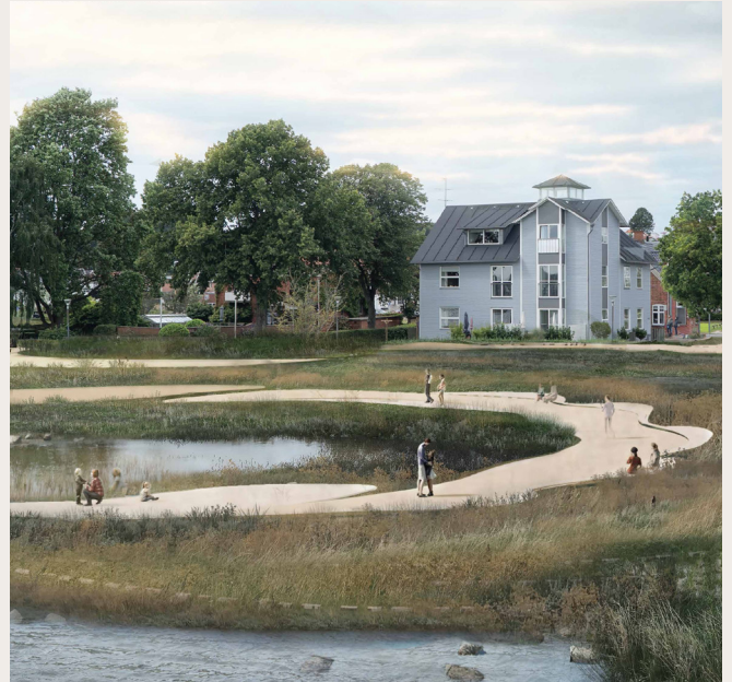
Forslag - 22937 (Indkøb) lavet af Studio Coquille og Aiming Spaces