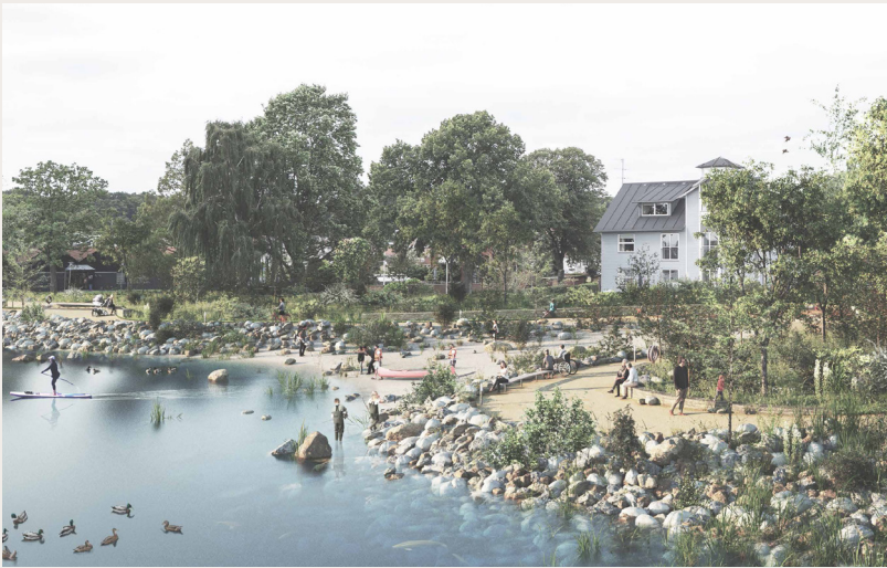
Visualisering fra vinderforslaget