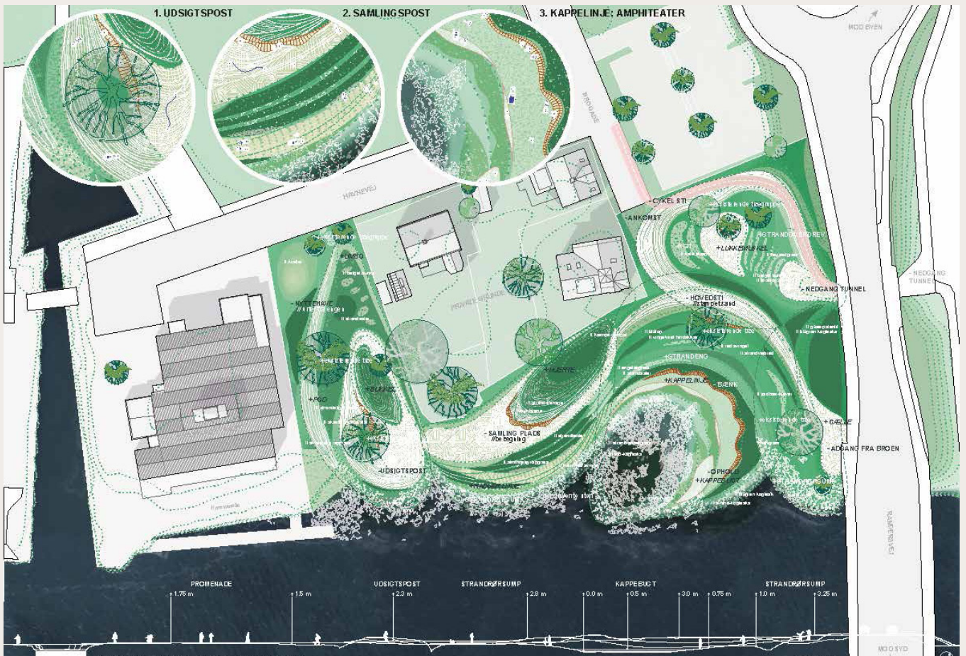
Forslag - 22937 (indkøb) lavet af Studio Coquille og Aiming Spaces