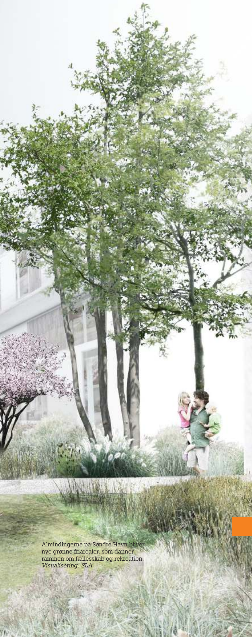
Almindingerne på Søndre Havn bliver nye grønne friarealer, som danner rammen om fællesskab og rekreation. Visualisering: SLA

Den nye bydel mellem Køges bymidte og vandet skal være bæredygtig i bredeste forstand - ikke mindst socialt, hvor hovedingredienserne er et varieret boligudbud og et miks af byfunktioner, gode rammer for fællesskab og en omfattende satsning på borgerdeltagelse og byliv.