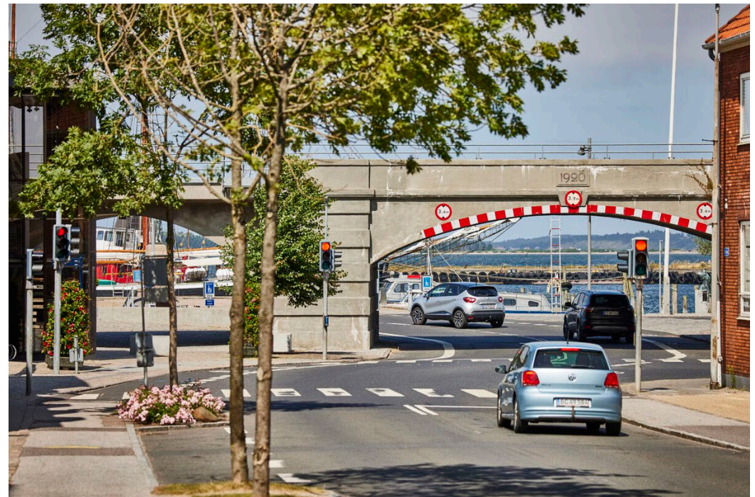
Struer / Brobuerne