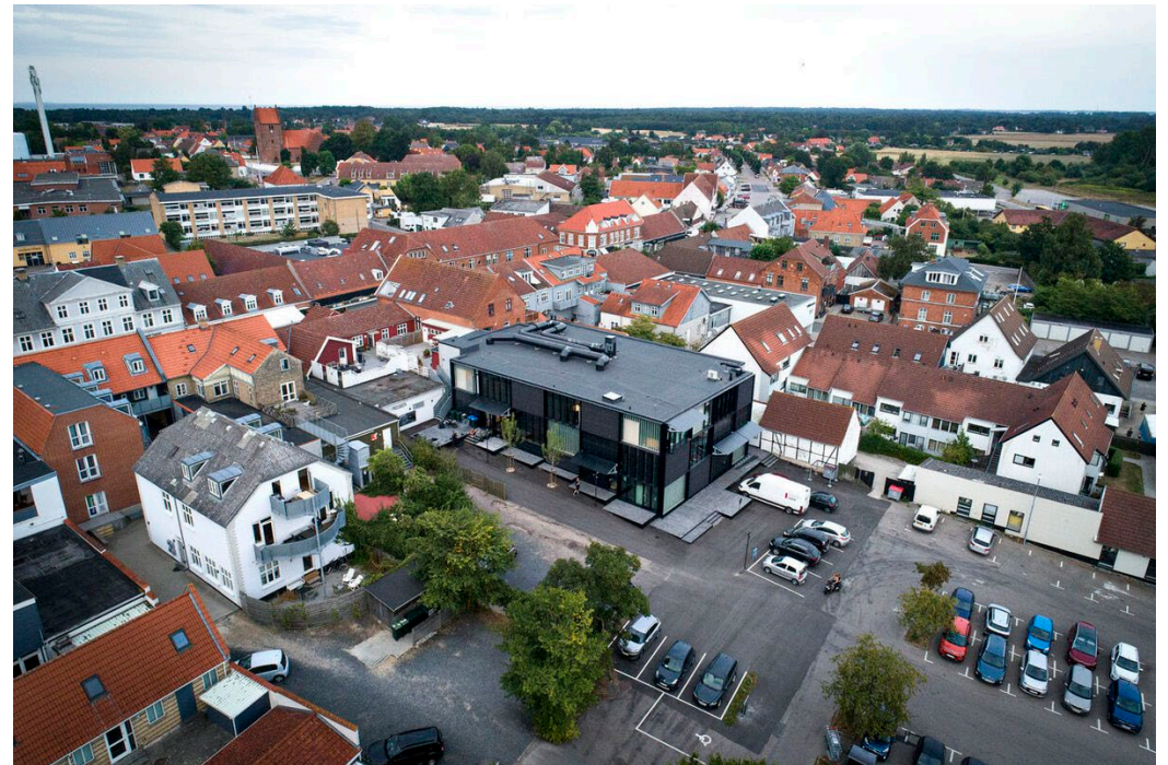
Nykøbing Sjælland / Odsherred Teater