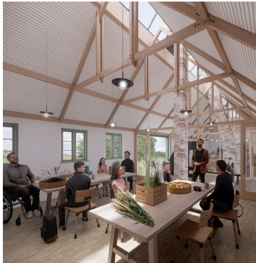
Madpakkerummet kan være åbent for offentligheden eller efter aftale. Det enkle og åbne rum står i smuk forbindelse med udstillingsrummet. Toiletet har niveaufri adgang både inde og udefra.