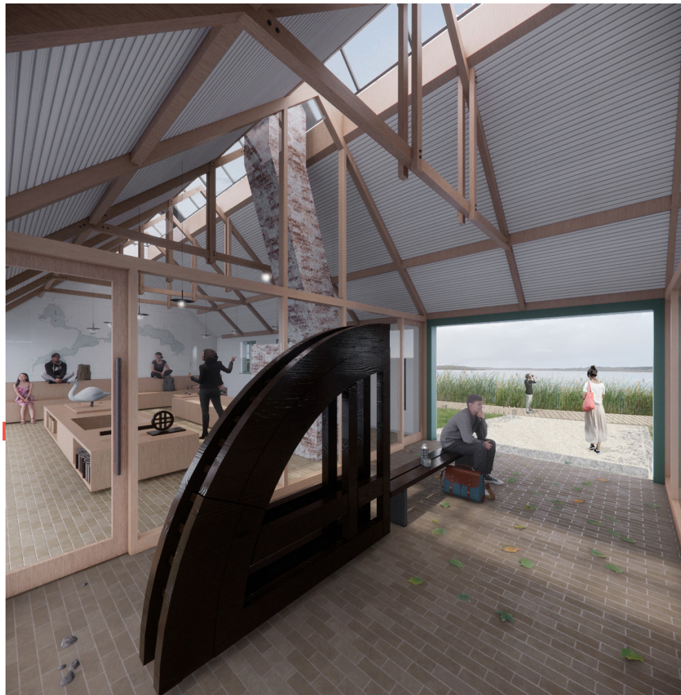
Det fleksible udstillingsrum kan forvandles efter ønske. Det eneste faste element er den gamle bægeovn der kan restaureres og bruges til at bage brød på traditionel vis. Det gennemgående teglgulv understreger husets grundrids og sammenhæng.