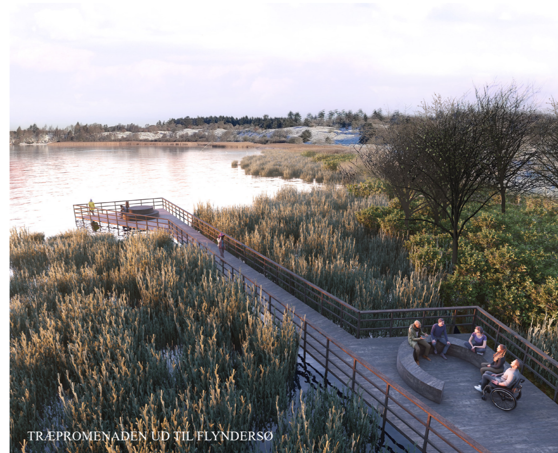
TRÆPROMENADEN UD TIL FLYNDERSØ