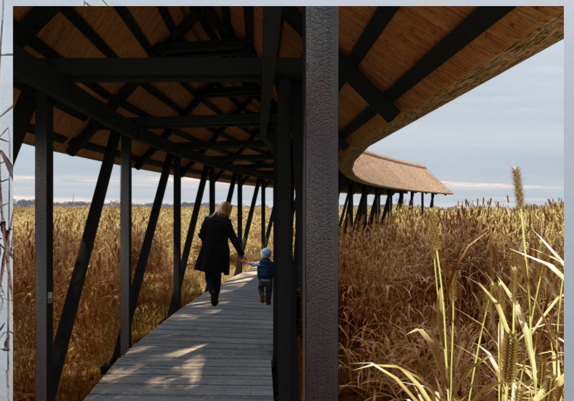
Visualisering: Iscenesat indlevelse i landskabet