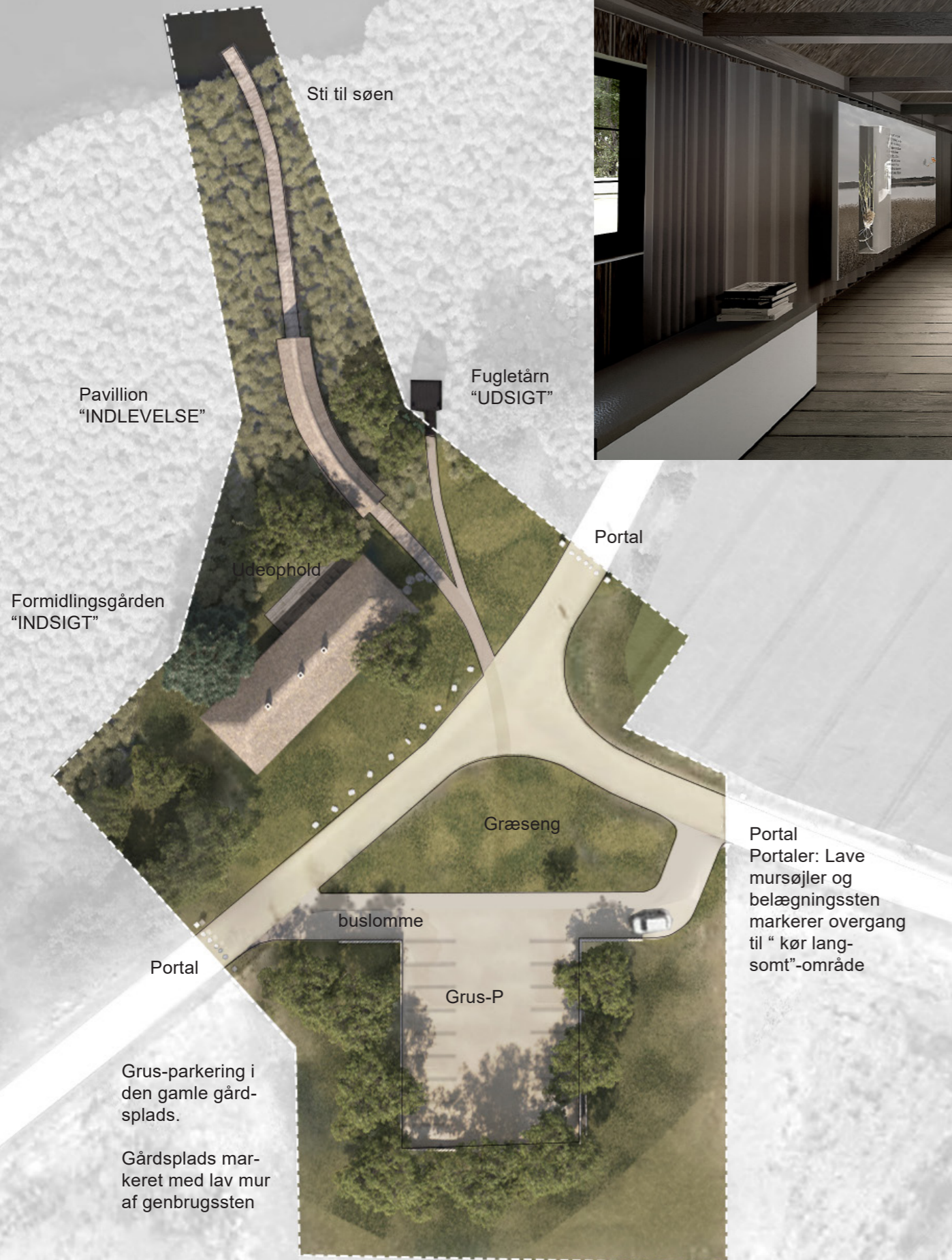
Situationsplan - 1:500