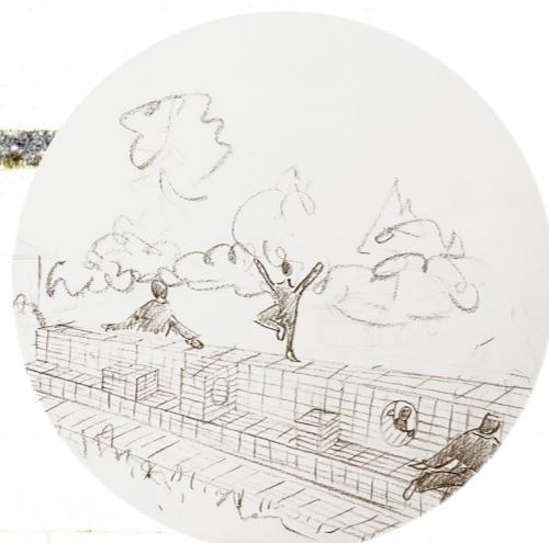
Solmuren i aktivitet