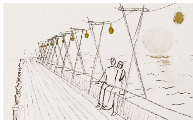
Havbadets lanternemole i solnedgang

Trækonstruktionerne tænkes udført i tætvekset fyr, som overfladebehandles med trætjære. Da materialerne er traditionelle og del af klassisk dansk håndværkstradition, kan nedslagene med fordel opføres og efterfølgende repareres og velligeholdes af lokale håndværkere.