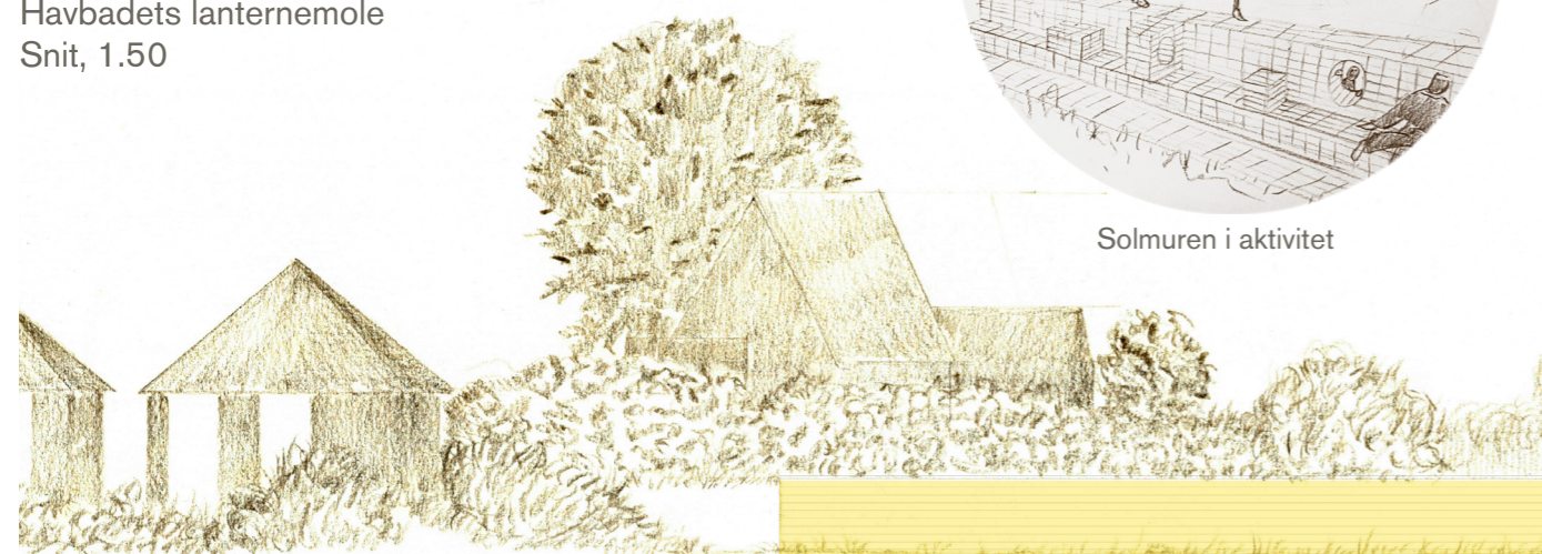
Solmuren i Jollehavnen Opstalt, 1:150