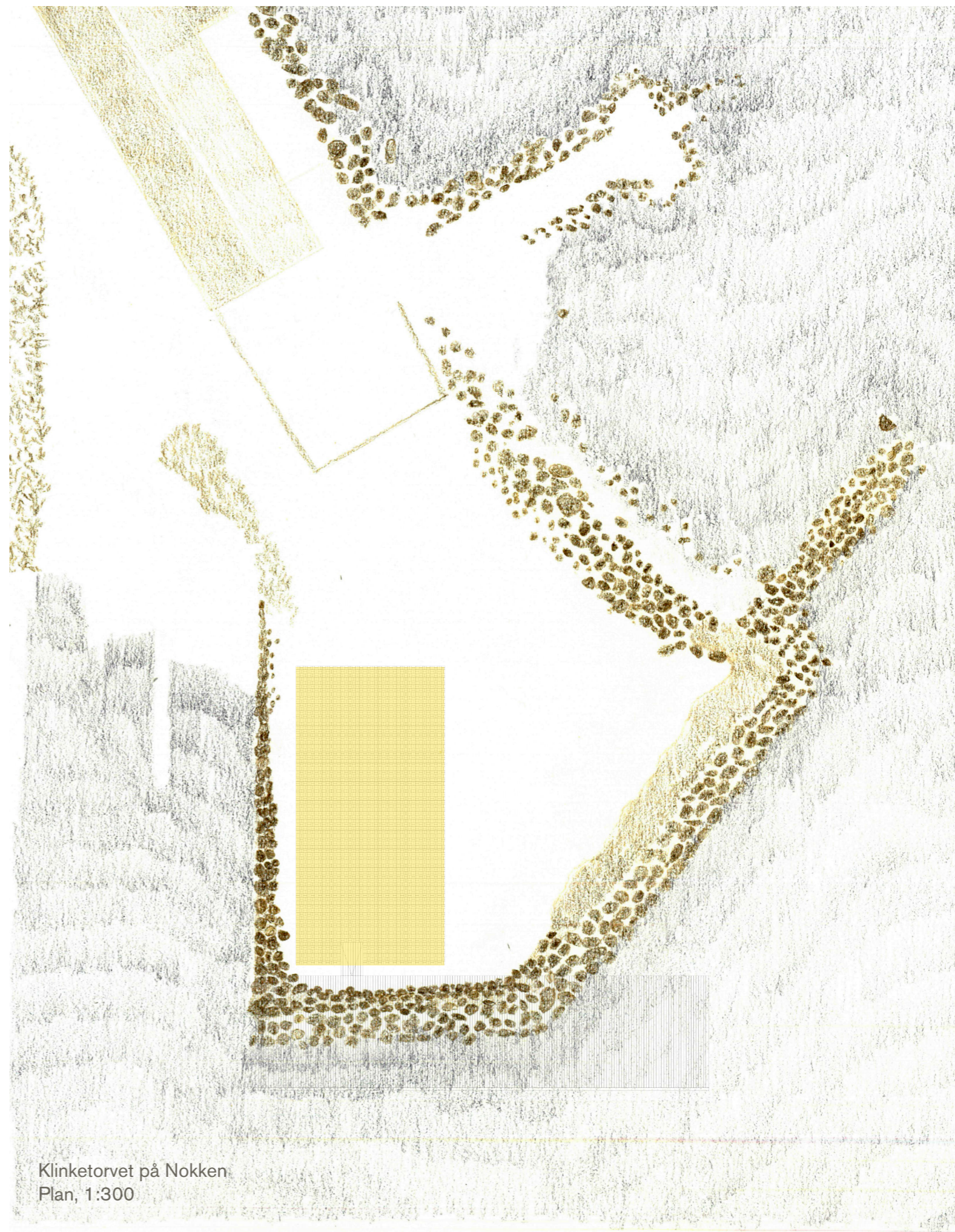
Klinketorvet på Nokken Plan, 1:300