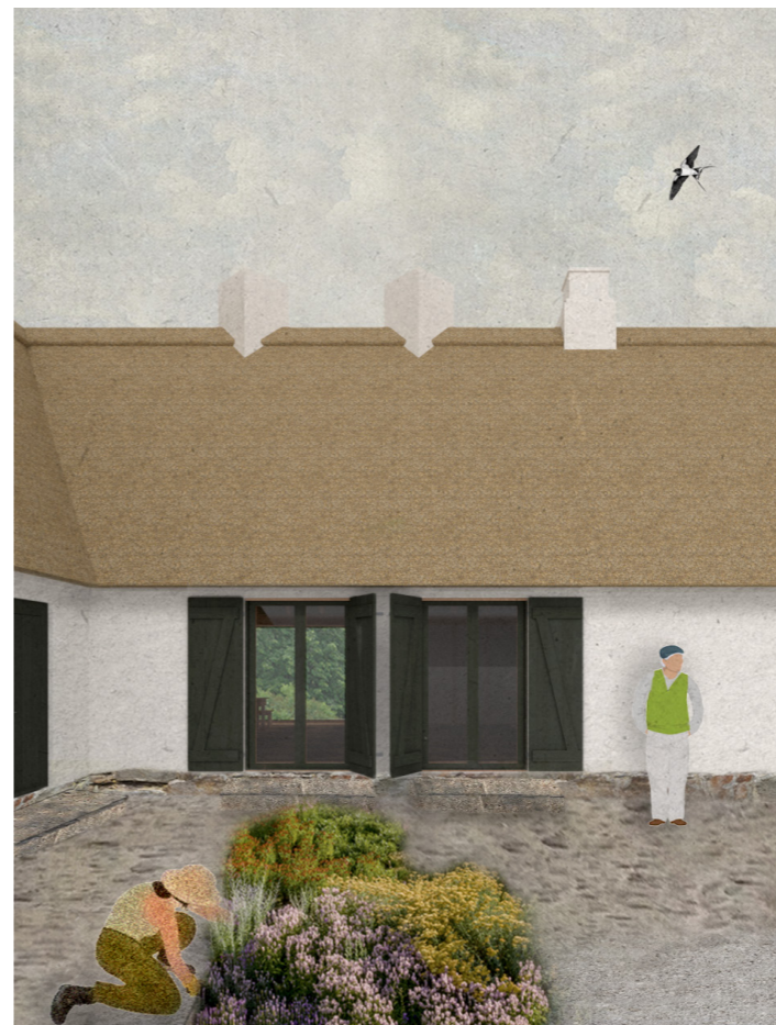
Gårdspladsen - Revledøre kan lukke af mod gårdspladsen. Skorstenen til højre er til brændeovnen, de to andre vinklede 'piber' fungerer som lysskakter i Møllestuen.