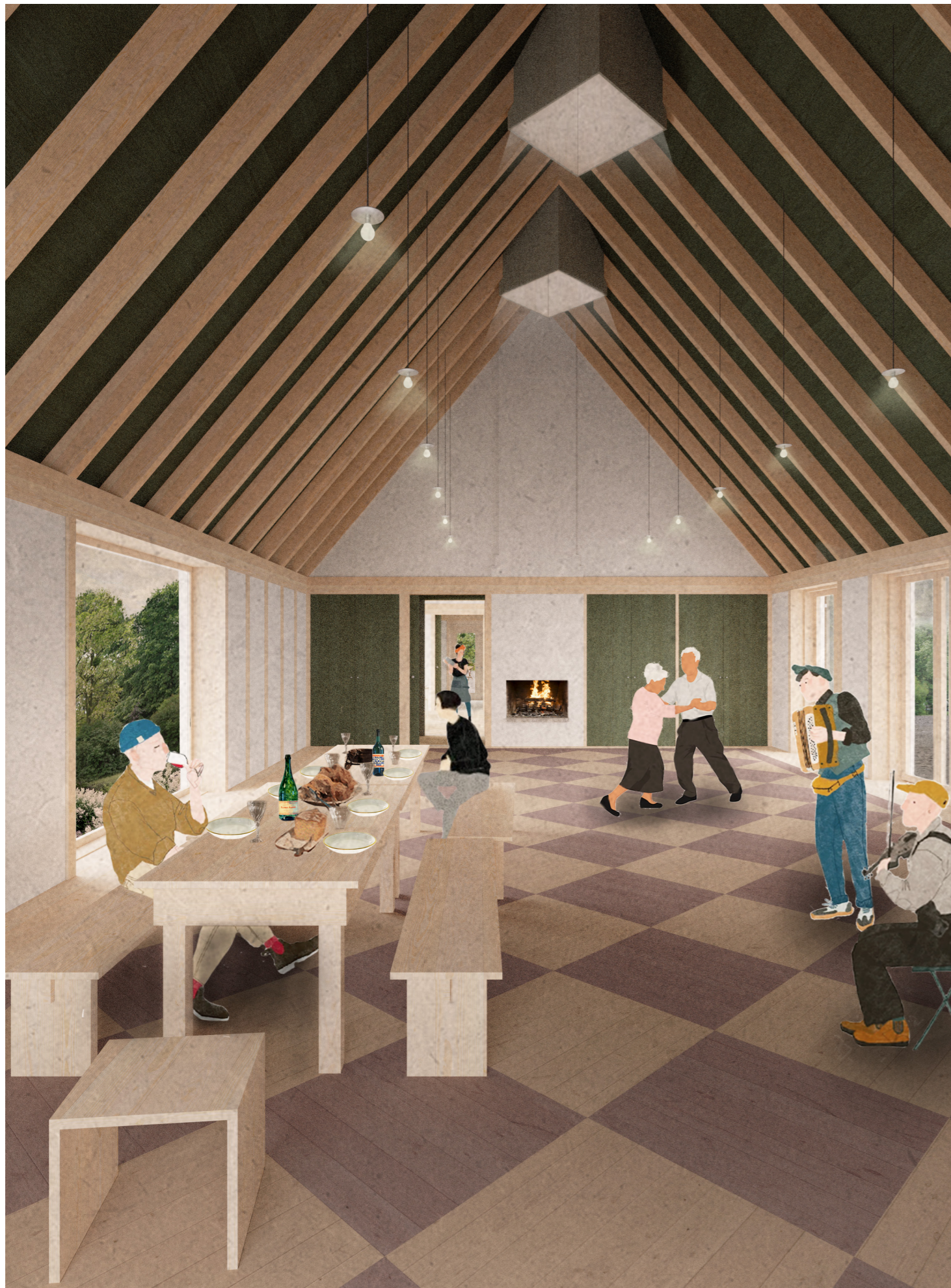
Møllestuen - Farver inspireret af Langelandsk egnsbyggeskik, en synlig trækonstruktion refererer til bindingsværket og de mange dokker, udkig til have til venstre og møllens krøjeværk til højre samt et festligt trægulv til dans.