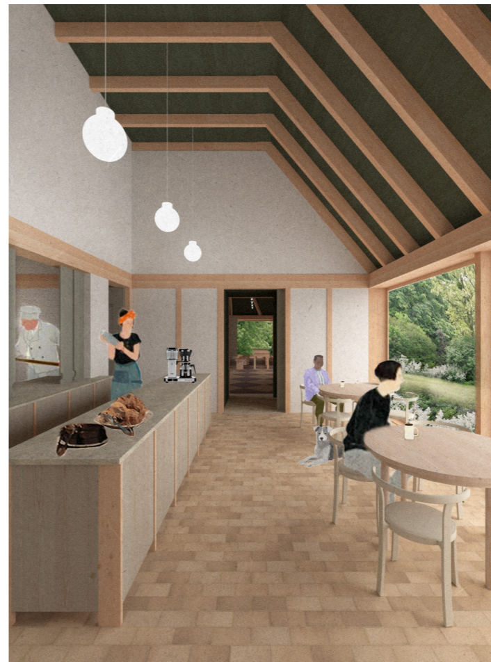
Café - Køkkenet kan åbnes op ved lejlighed, og der kan laves mad med udsigt til haven. Hele bygningens længde kan fornemmes helt fra ankomstrummet.