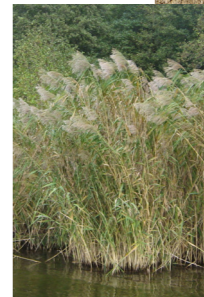
Tækkerør til stråtag