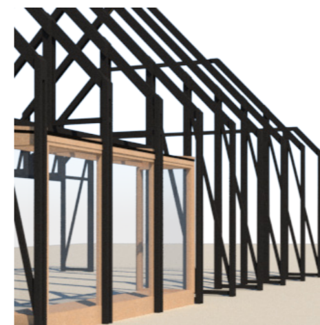
En ny spærkonstruktion af sorttjæret træ, rejser på skruefundamenter i ruinen. Her ses den første præfabrikerede karnap sat ind.