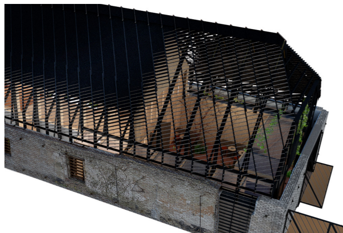
Forslaget genetablere omfanget af det store tag, men et kig oppefra, svarende til kigget fra Møllen (eller solens stråler), viser en stor transparens der glider over i et lukket tag over Møllestuens varme krop.

Repetitionen af mindre ens stykker træ, refererer både til sektionerne i møllevingerne og til skala og repetitionsgraden i møllens egespåns beklædning. På den måde har Møllestuen både en hilsen til sin forgænger, Stalden, og en samhørighed med sin nye formålsfælle, Møllen.