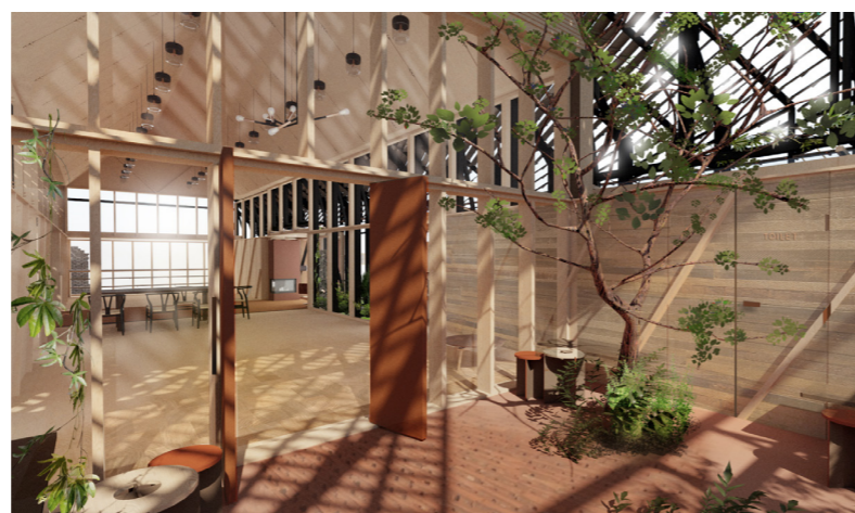
Kig gennem åbne døre fra gårdhaven og ind i Møllestuen. Pejsen er muret op af genanvendte sten fra gården. Op mod det store vinduesparti i nordgavlen er den åbne del af køkkenet - fem meter arbejdsbord med udsigt over haven. Det er ambitionen at bevare det krogede træ - det er indmålt og vist her.