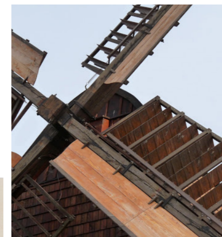
Det gamle sort-hvid foto viser skygger fra møllevinger ala dem på billedet til venstre. Tagets udformning med gentagelse af ens, skråstillede træsektioner i varierende vinkler er inspireret af møllevingens bølgede transformation mellem lukket effektivt vindsegl og åben saks position.