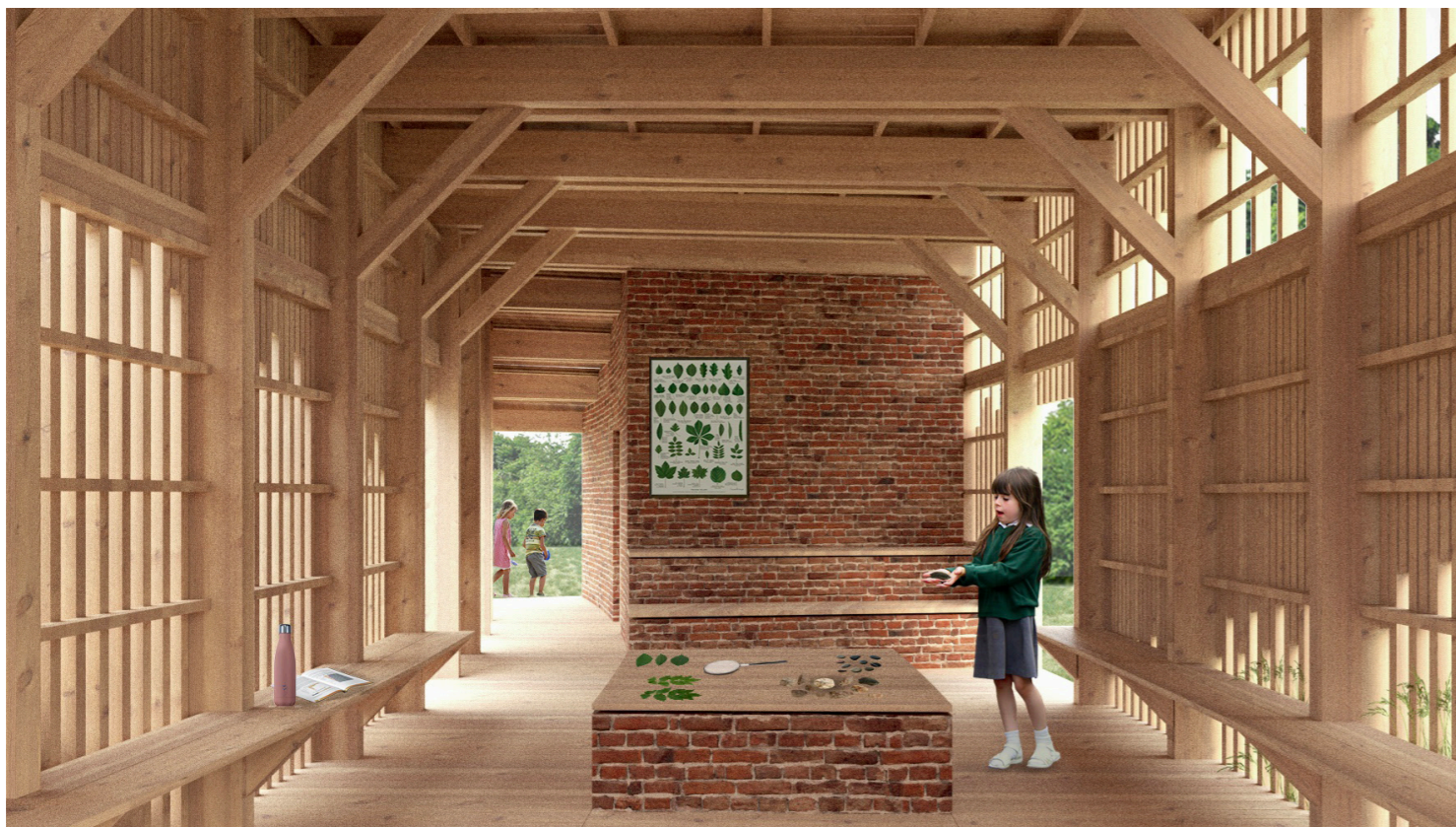
Opholdsrum i madpakkehuset/naturformidlingslokalet