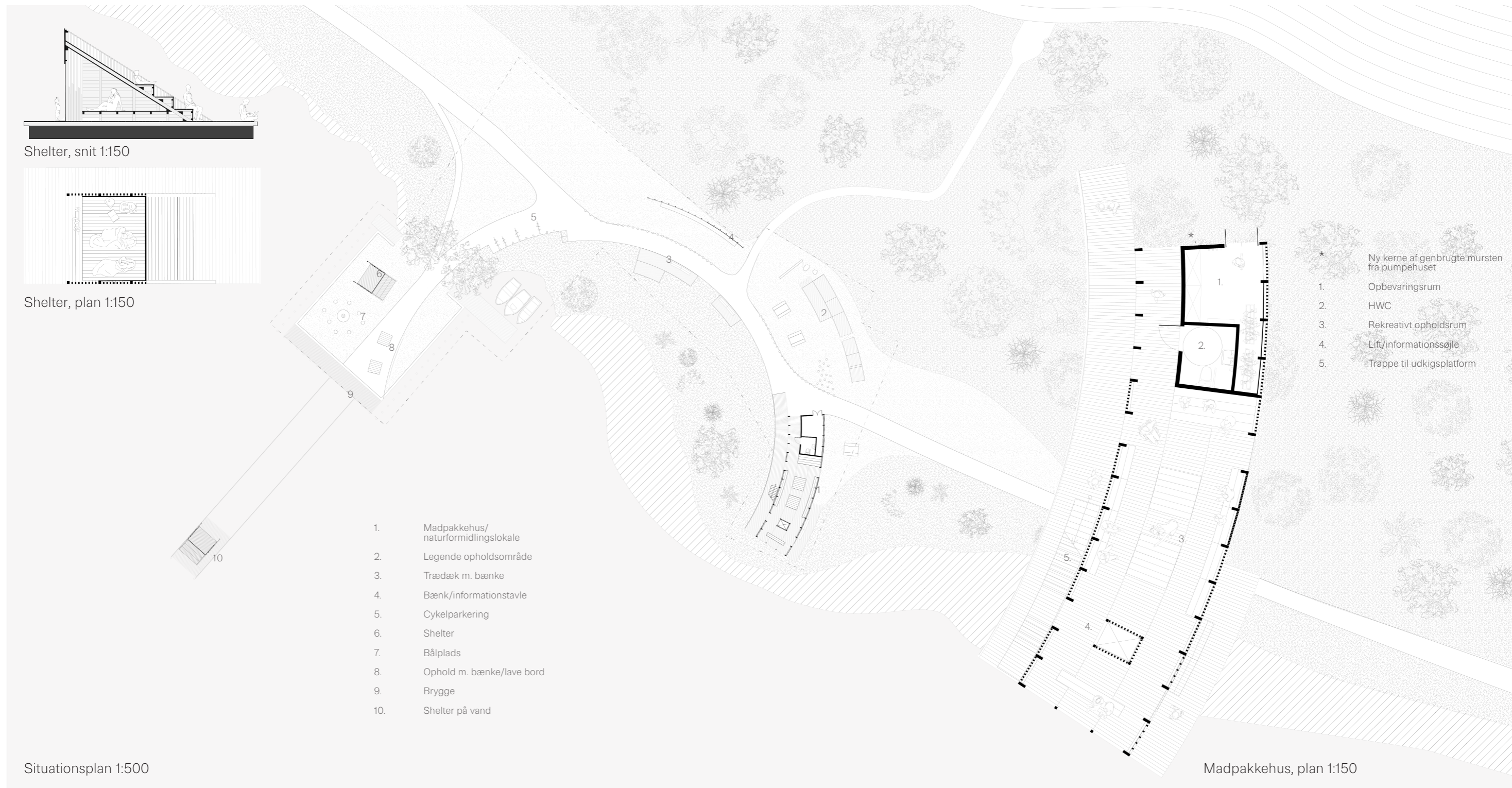
Shelter, snit 1:150