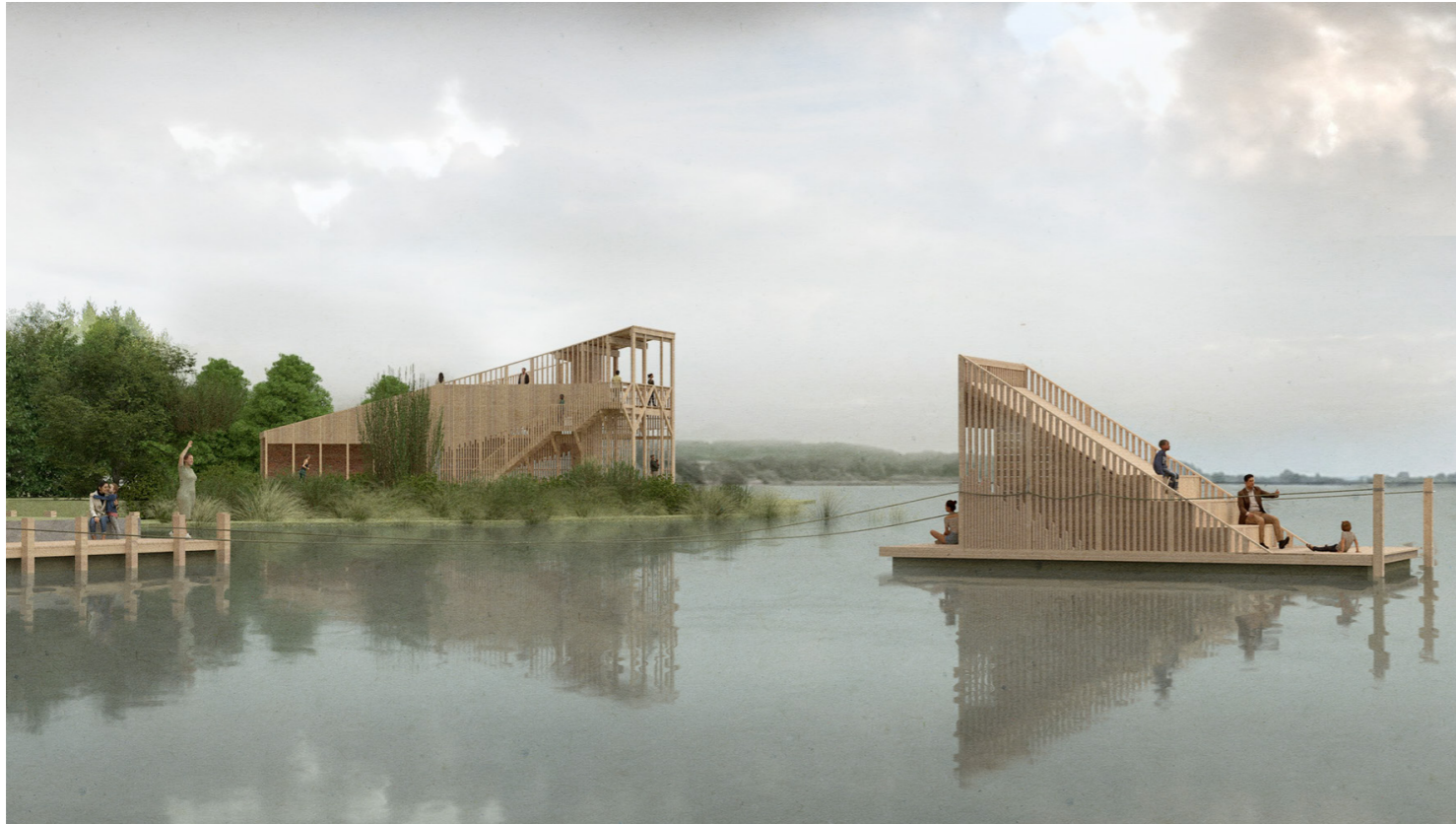
Perspektiv fra vest