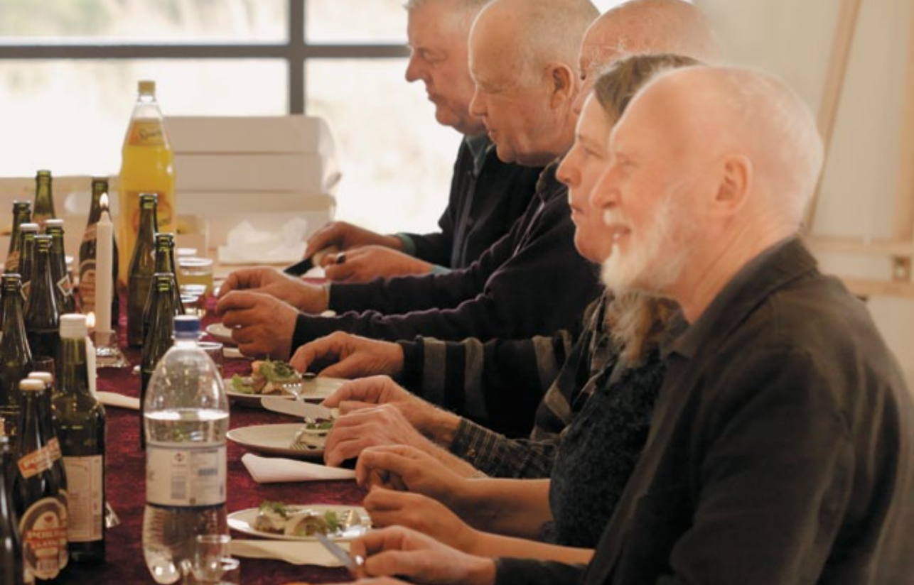
Arbejdsholdet nyder en velfortjent frokostpause efter dagens arbejdsindsats.