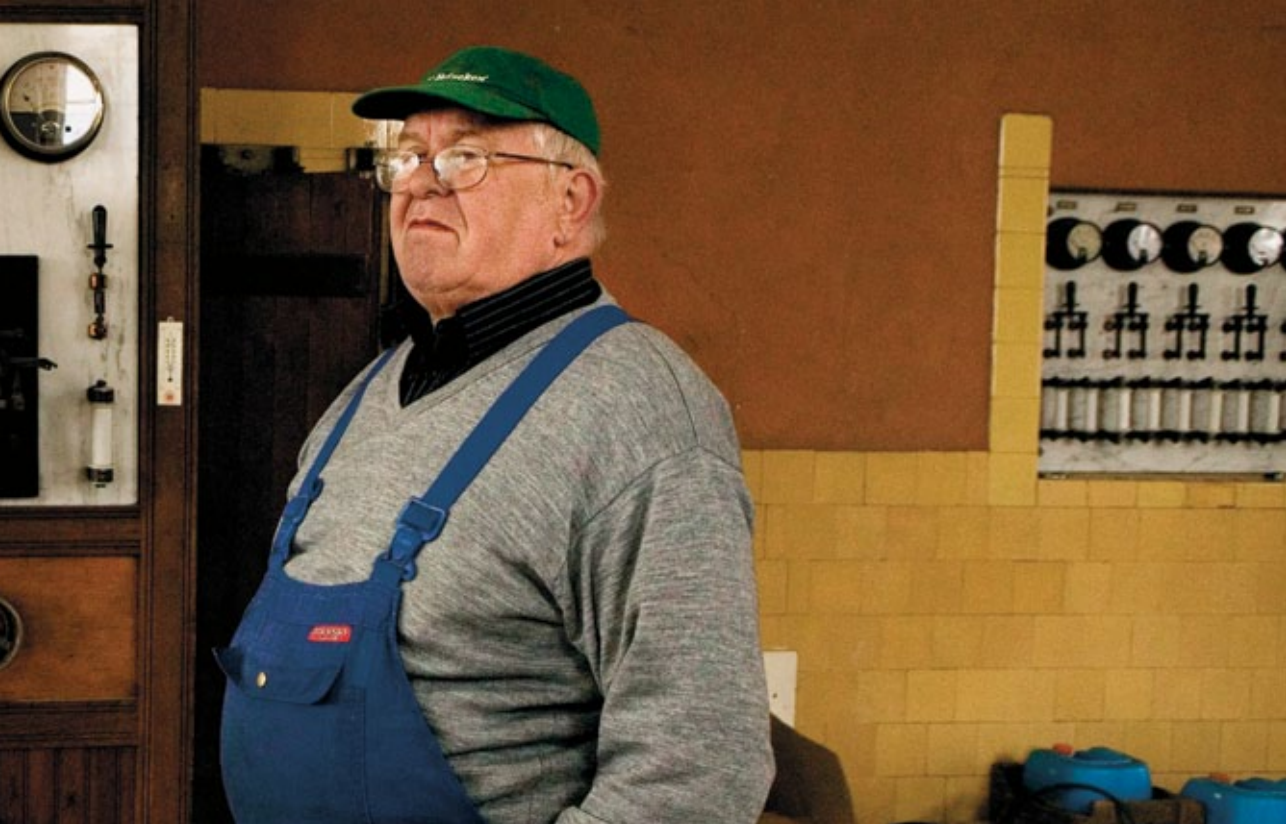
Møllens originale fordelingstavle i marmor er et velbevaret klenodie for mange af ildsjælene.