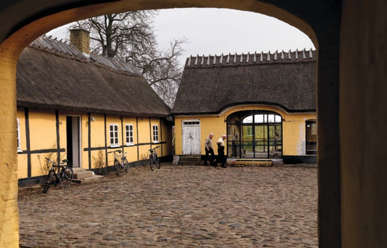
Den firlængede gulkalkede bondegård har fået nyt liv i form af lokale udøvende kunstnere.