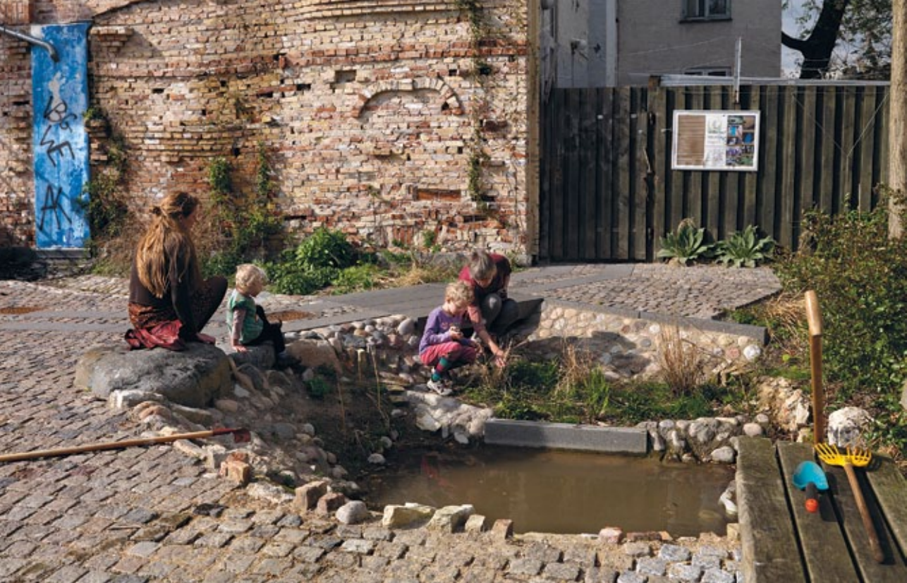
Foran muren findes et lille regnvandsbassin, der opsamler vandet fra gavlen.

eksperimenterende idéer og derfor til tider har været meget tungt at arbejde med. Knap syv år er gået fra idéen til den første kommunale bevilling i 2003 og til realisering af den vertikale have i maj 2009.