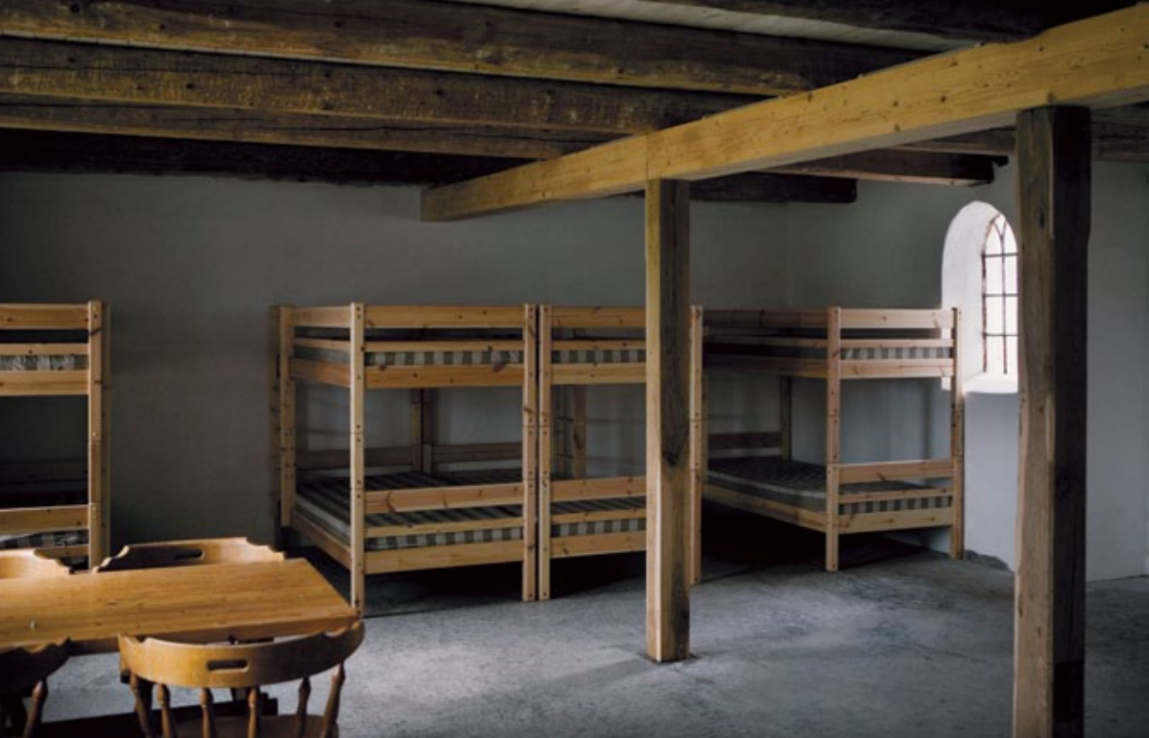
Inden længe bliver soverummene fyldt med vandrende, der går langs Hærvejsruten.

gamle spær træder tydeligt frem i loftet, og vinduernes form og struktur er bevaret.