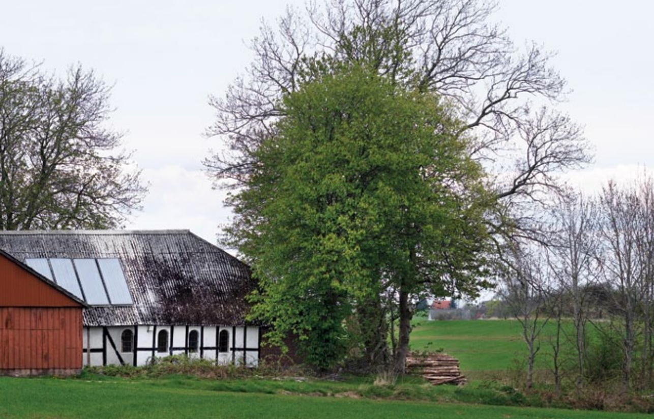
11 ombyggede jyske gårde udgør herbergerne langs Hærvejen.