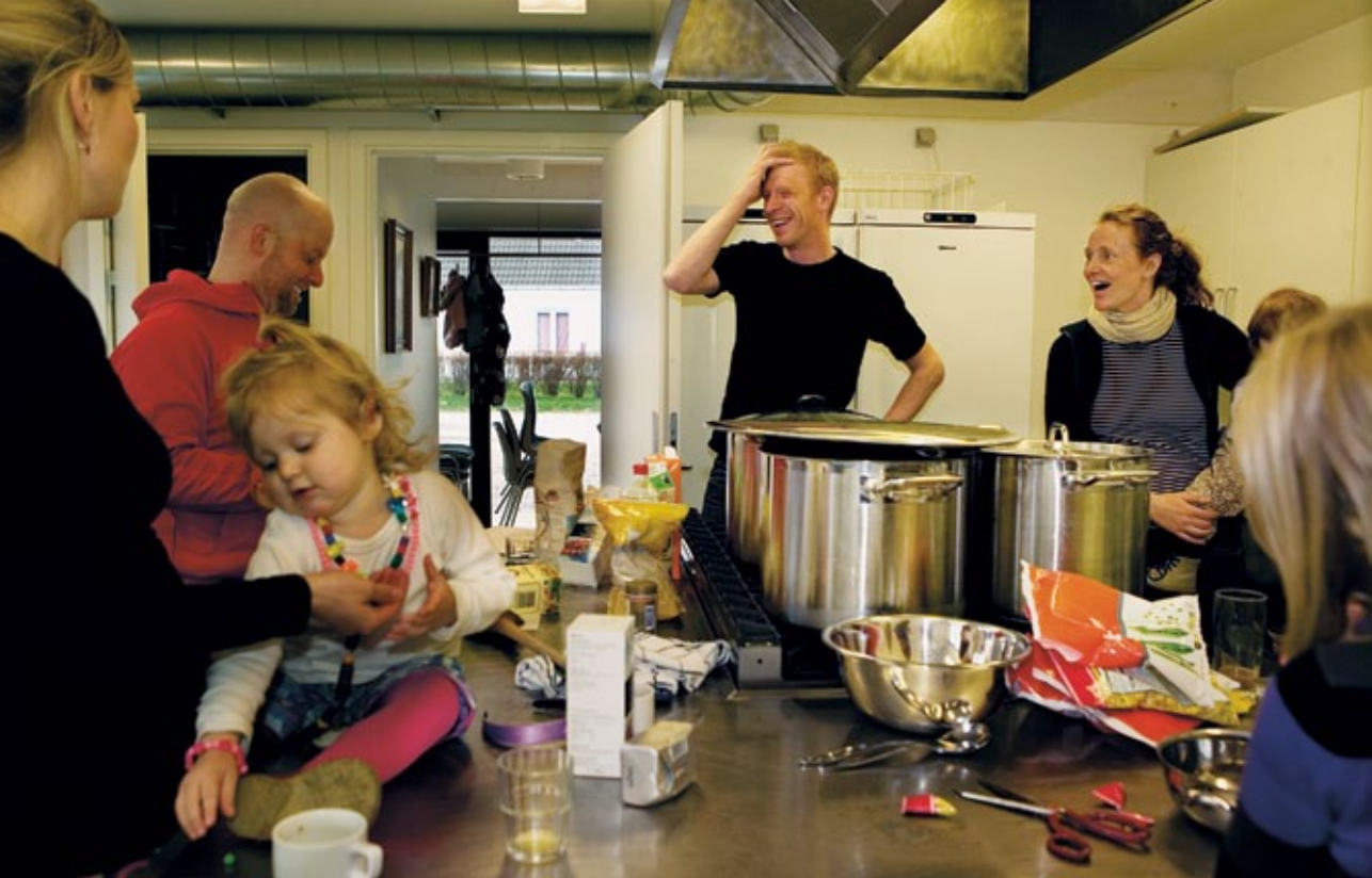
Den månedlige fællesspisning er en god anledning til at få talt med andre Nørholmboere.

Støjen skabte splid i den lille by, der blev opdelt mellem dem, der havde sympati med ofrene for støjen, og dem, der mente, at bestyrelsen havde forsøgt at gøre et godt stykke arbejde, men været uheldige med rådgivere, der ikke var grundige nok i arbejdet med udformningen af forsamlingshuset.