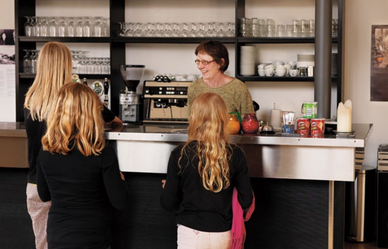
Caféen er Huset på Næssets naturlige mødested og drives af projektets frivillige.