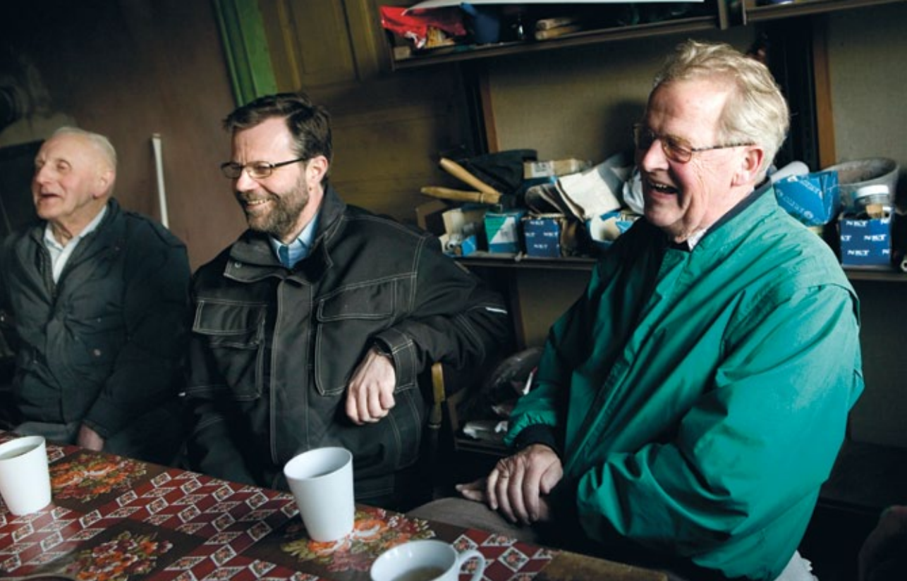
Jollmands Gaard er i allerhøjeste grad et socialt projekt, hvor ildsjælene mødes om en fælles opgave og interesse.

nogle af de første udfordringer, der mødte projektet. “Da først Realdania begyndte at fatte interesse, skal jeg love for, at der begyndte at ske noget. Så var det nemmere at få andre fonde til at give noget.”