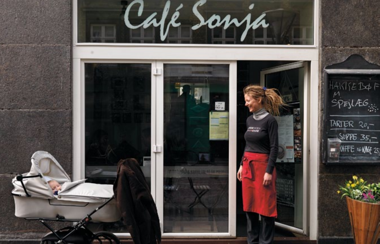
Café Sonja er omdrejningspunktet for Sidegadens udendørs liv.

de fleste beboere godt ved, at Vesterbro er et mangfoldigt område med plads til skæve eksistenser, er der enkelte beboere, der gerne vil have 'kulissen Vesterbro' uden at konfronteres med miljøet. Generelt er beboerne i området dog flittige kunder i Sidegaden, og de kommer altid og siger tak for en god aften efter Sidegadeprojektets årlige gadefest.