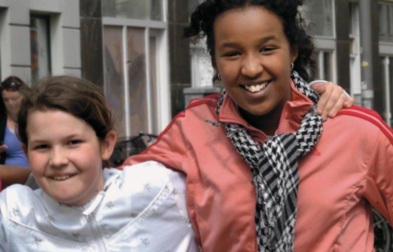
Sidegaden tiltrækker mange af Vesterbros beboere.