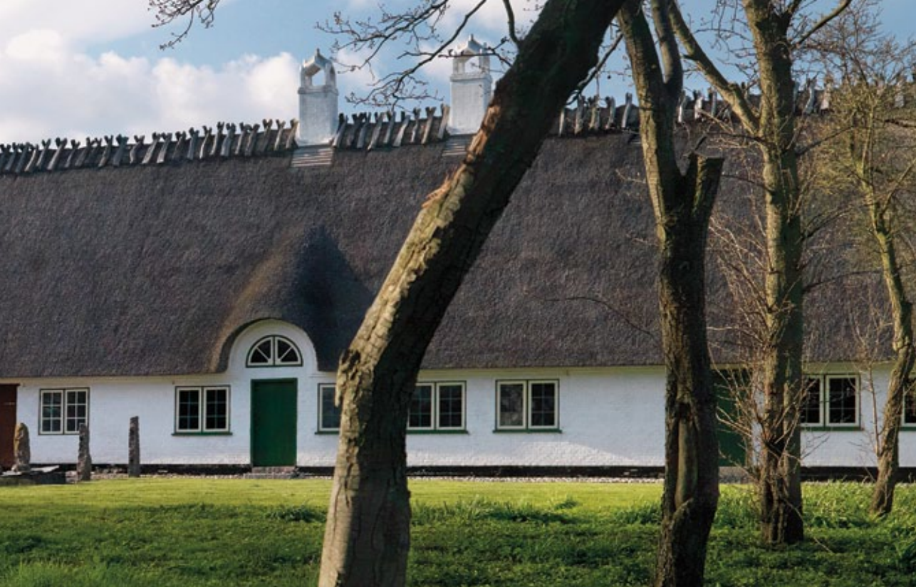
Den gamle alsiske kroggaard Jollmands Gaard blev fredet i 2001.