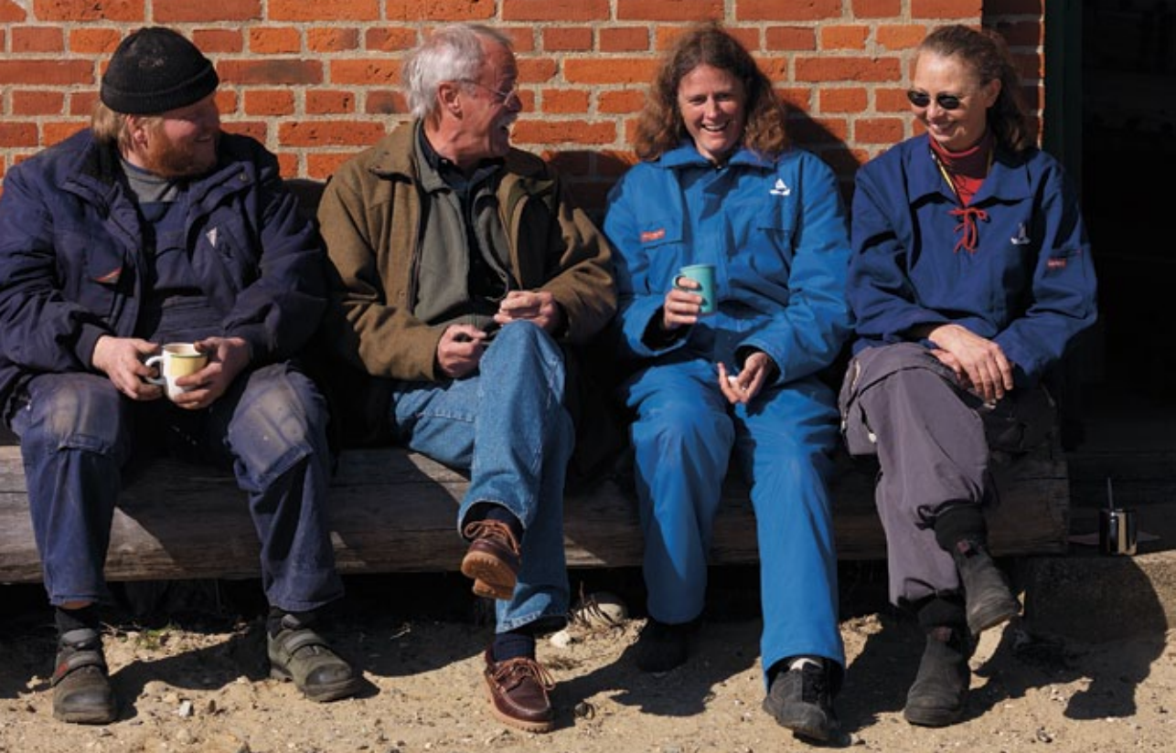
Bådebyggerlærling, formidlingsansvarlig og frivillige fra bådelaene i pausen mellem arbejdsopgaverne.

Arbejdsgruppen arbejder nu på idéer til, hvordan der i det nye byggeri kan indrettes en bedre formidling, der åbner dørene for interesserede, men også holder gæsterne en smule mere på afstand af de arbejdende bådebyggere.