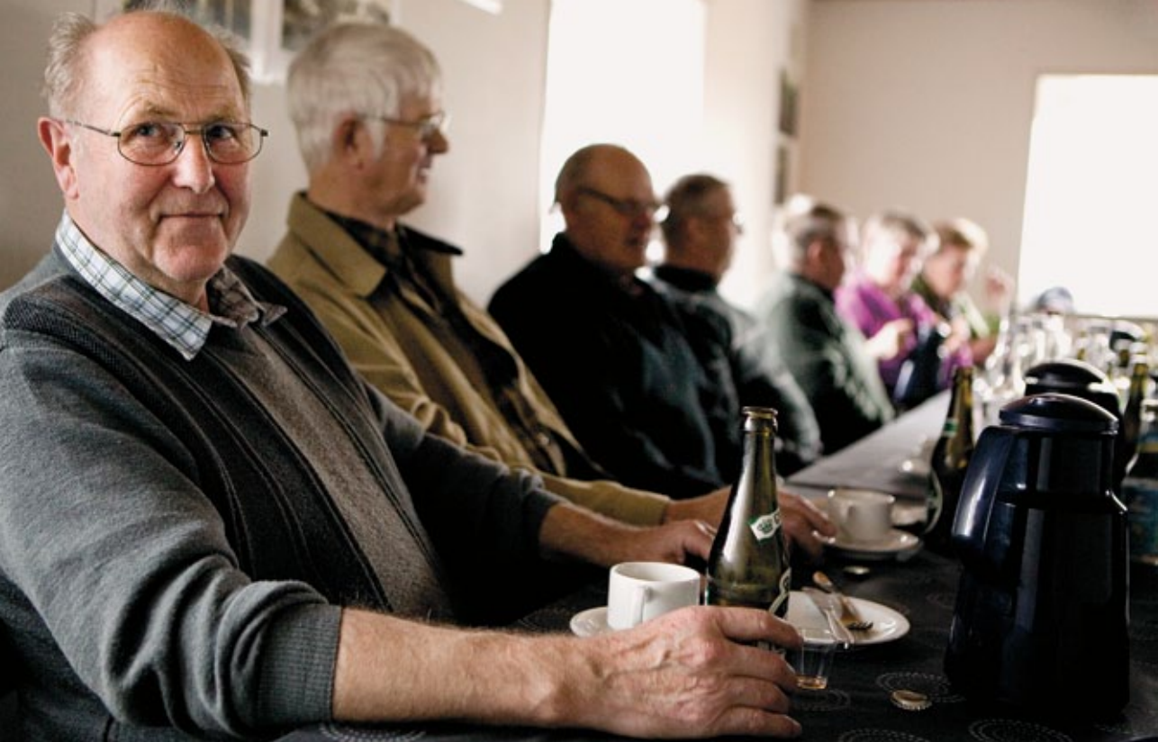
Lydum Mølle fungerer som ramme om et værested, der hver uge samler den lille landsbys seniorer.

Mølle skaber også fællesskab og livskvalitet blandt alle dem, som giver en hånd med på projektet.