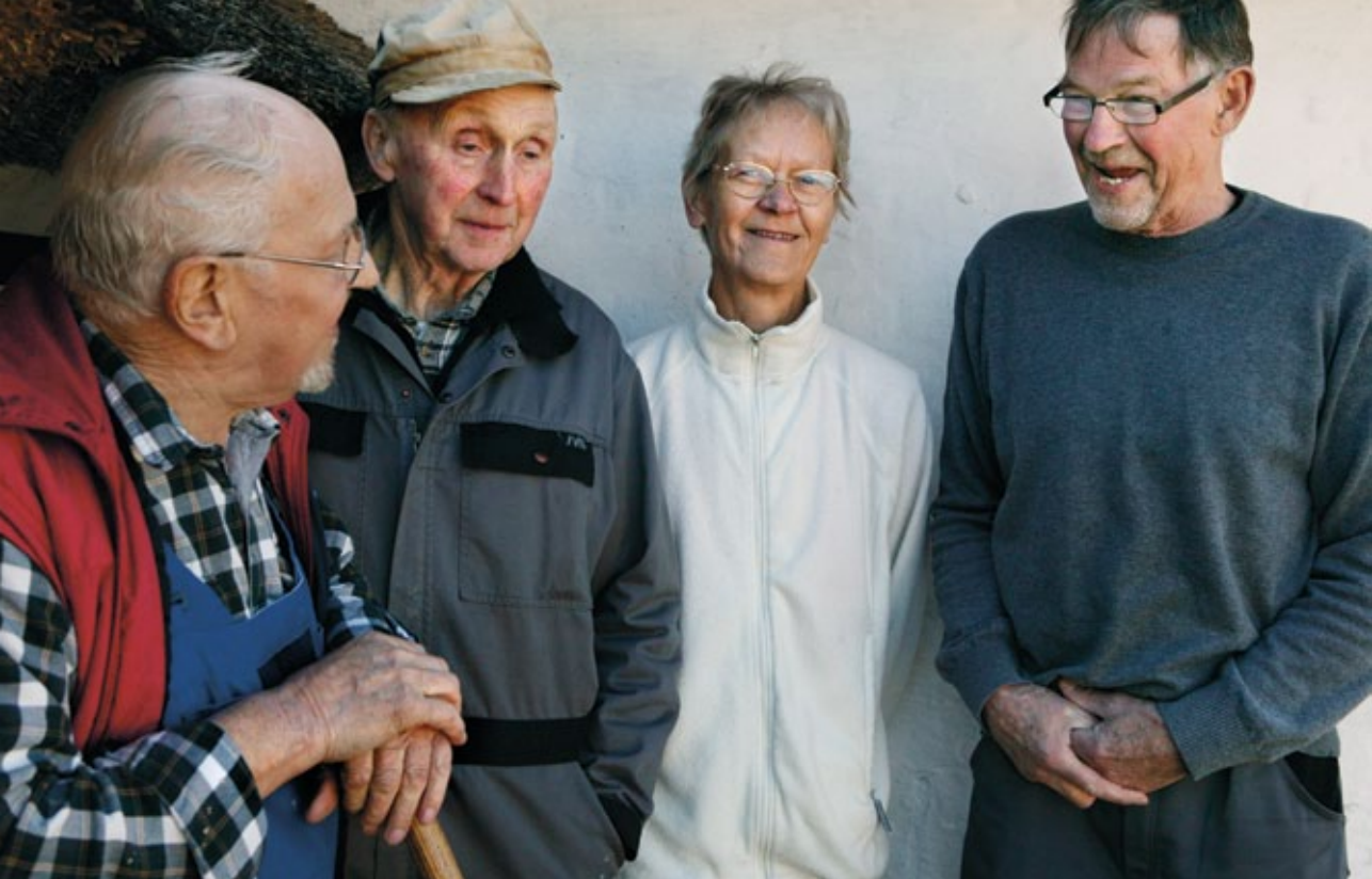
De gamle skolekammerater har nu igen fået noget at samles om i Gerå.