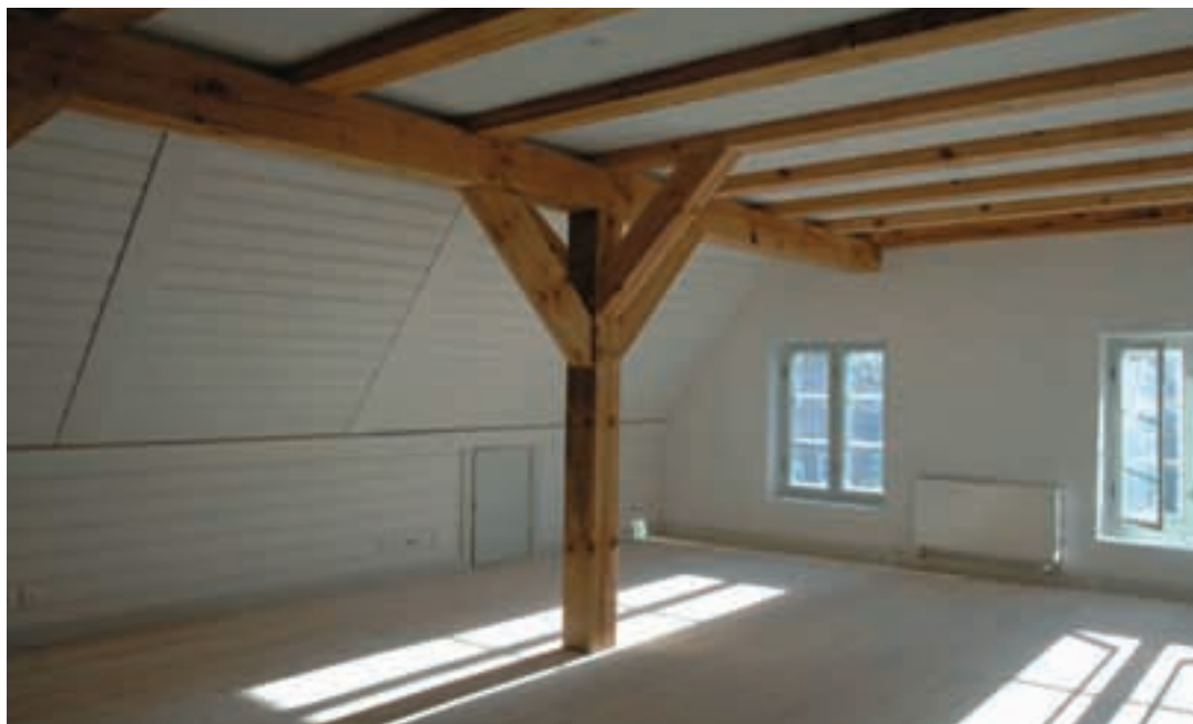
Den nyindrettede 1. sal i pakhuset.

ste sig, at pakhuset ikke var bygget på dybe fundamenter, men i stedet på et lag af syldsten, hvorpå der var muret en sokkel. Det er på denne sokkel, at bindingsværket er lagt. Samme simple fremgangsmåde blev anvendt indendørs, hvor søjlerne blot var stillet på en sten.