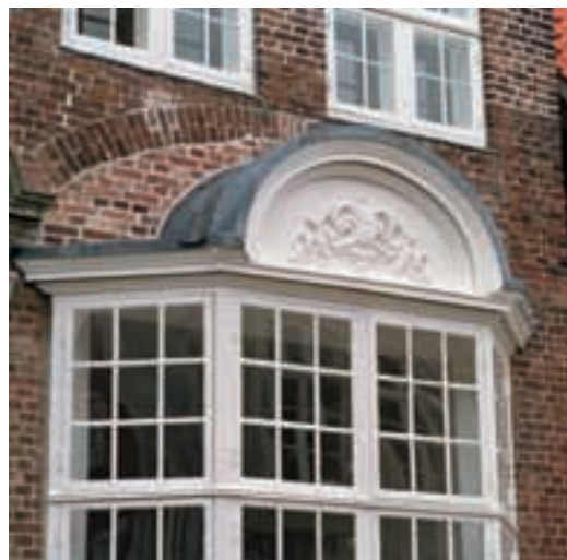
Til højre: Karnappernes belægning er ført tilbage til bly.

nedbrudt og i opløsning, dog har den været tilstrækkelig intakt til, at man kunne modellere gipsmodeller til at hugge efter.