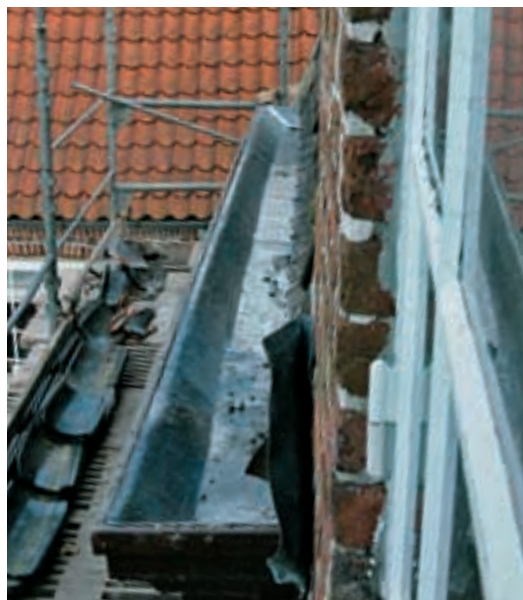
Gesimstagrenderne fores med bly for at hindre råd.

Før restaureringen var karnappernes tage belagt med kobber udført på moderne vis med nitter. Ved opførelsen i 1777 har man uden tvivl anvendt bly, og kobberet er derfor udskiftet med