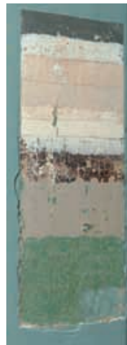
Den farvearkæologiske undersøgelse afslørede ikke færre end 11 farvelag.

Man kan kun tilnærmelsesvis sige, hvornår de enkelte farver på panelerne er fra. De første to har således holdt ca. 50 år, altså fra opførelsen i 1777 til sidst i 1820'erne, mens de mørkere farver kommer omkring midten af 1800-tallet. Der er tale om træimitationer, der skal få malingen til at ligne en bestemt træsort. Mahogni, valnød og ahorn var almindelige imitationer på det tidspunkt; i Digegrevens Hus er det egetræ, der er imiteret over to omgange. Alle de hvide farvetoner er fra 1900-tallet, mens den sidste grå er ca. 10 år gammel.