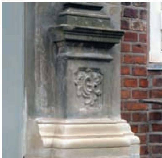
Til venstre: Dele af sansstensportalen måtte nyhugges.