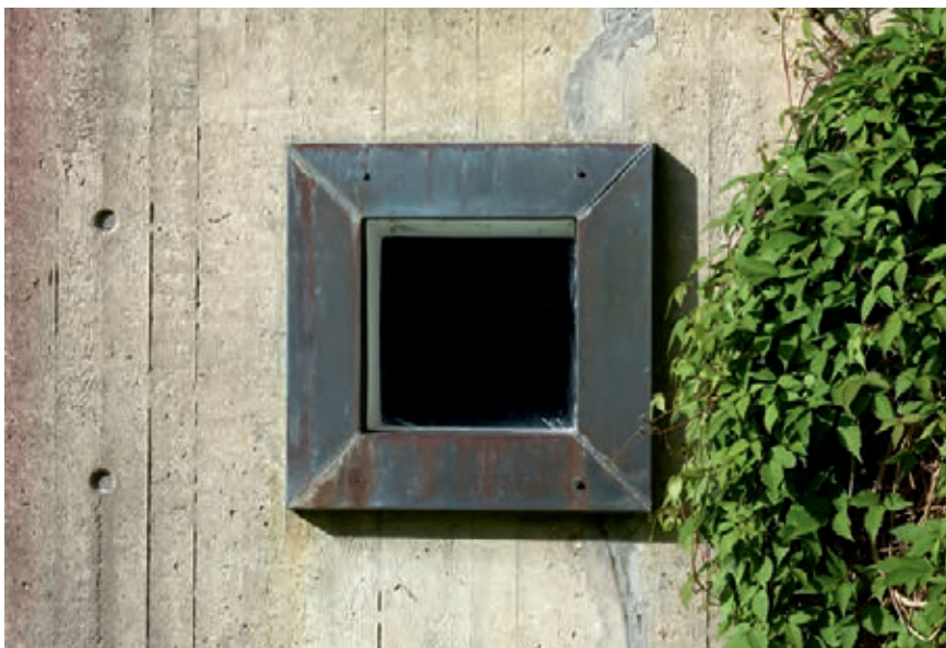
Både nord- og sydgavlen har et ganske lille vindue med indvendig, blåmalet skodde.