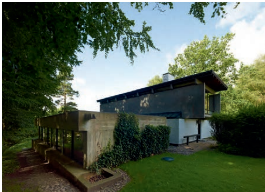
Værelsesfløjen fra 1970, placeret øst for og parallelt med hovedhuset. Tilbygningen er delvist nedgravet i terrænet og korresponderer med hovedhusets overetage ved at fremstå som en rå betonkonstruktion, hvis høje fundament, vægge og stern går ud i ét og har tydelige spor efter forskallingsbrædder.