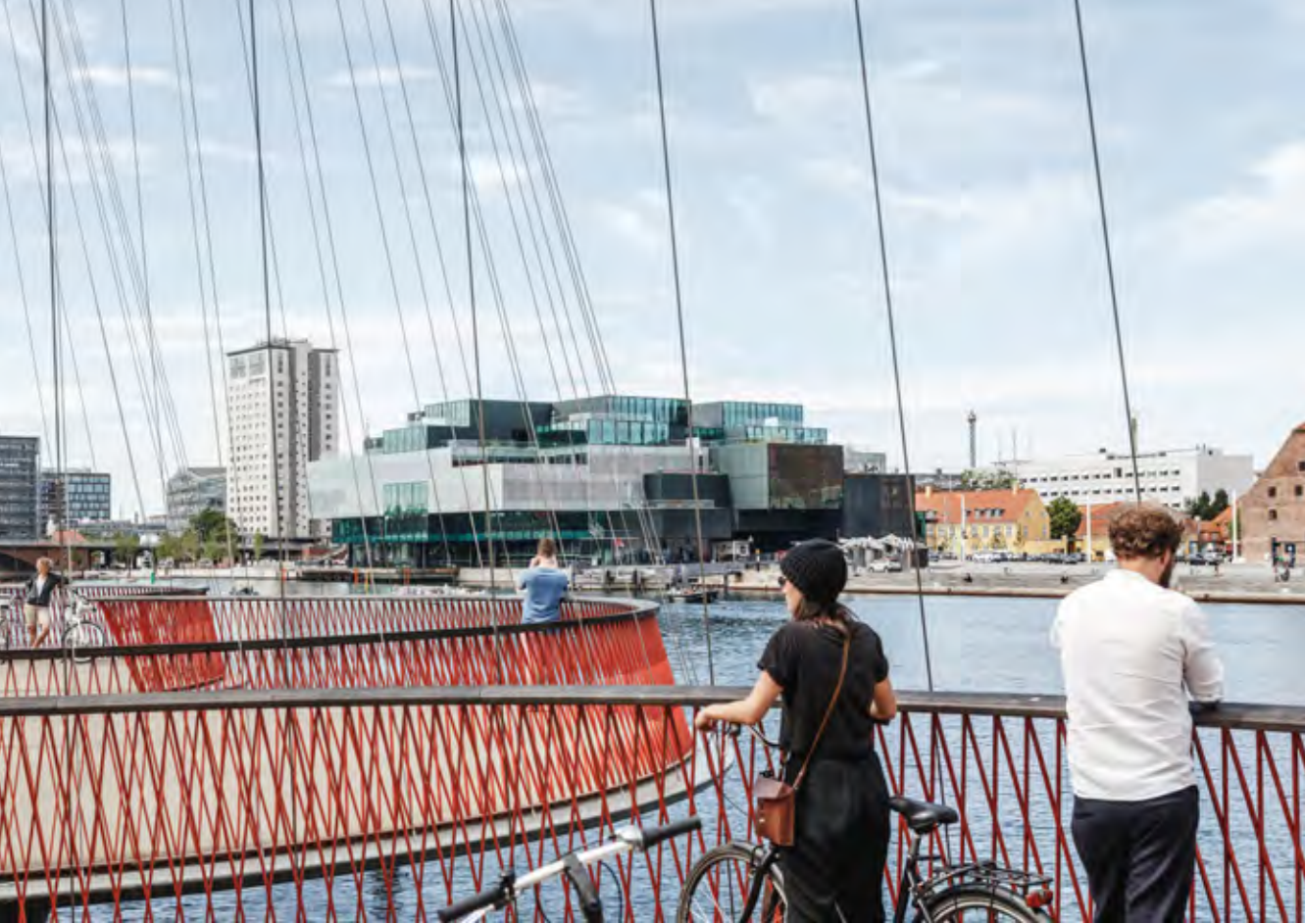
Cirkelbroen er et funktionelt kunstværk af Olafur Eliasson, skabt til Københavns Havn.