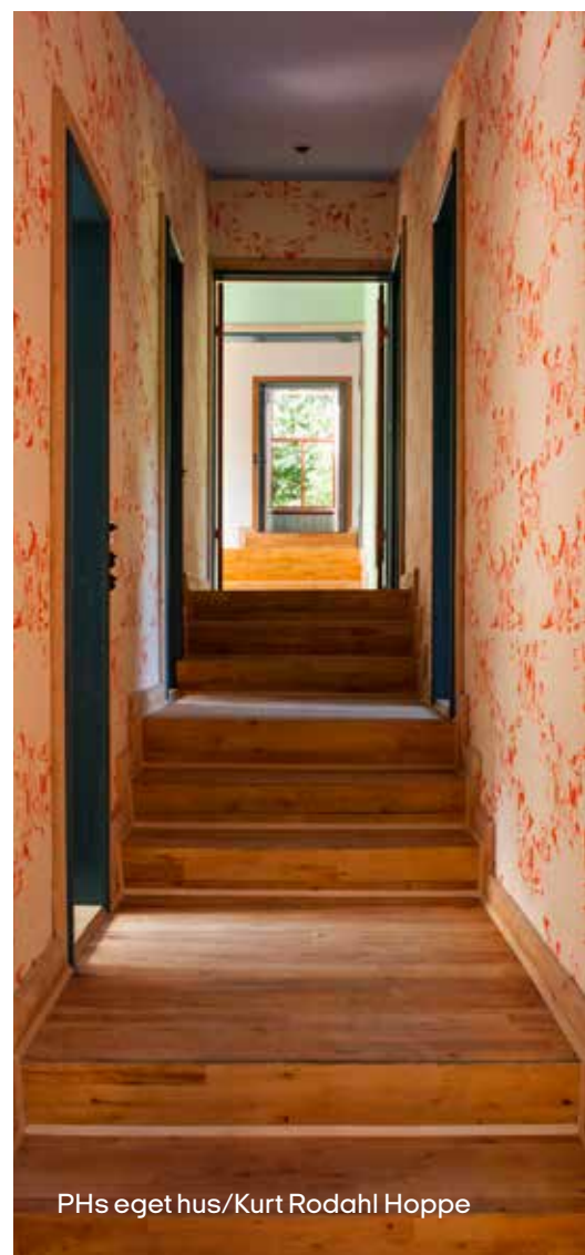
PHs eget hus/Kurt Rodahl Hoppe