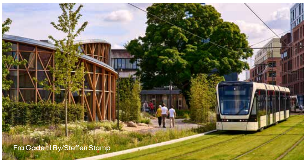
Fra Gade til By/Steffen Stamp