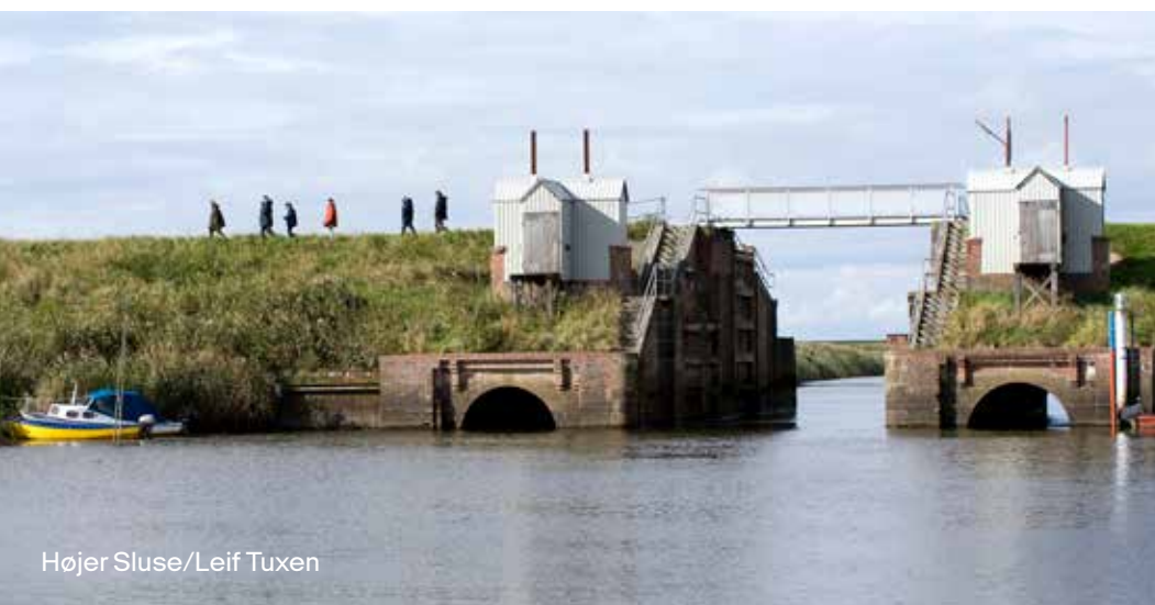
Højer Sluse

Danmark er bygget op af stærke lokalsamfund, som formes af de landskaber, de bygninger og de traditioner, der findes lokalt. Vi har en stærk foreningstradition, aktive iværksættere og et rigt kulturliv, og vores bygningsarv og byer bidrager til vores identitet og følelsen af at høre til. Der ligger et betydeligt potentiale i at udvikle lokale kulturtilbud, understøtte de lokale erhverv, styrke foreningsliv, mødesteder, byrum og at udvikle by- og boligområder med forståelse for udgangspunkt i stedets historie, kultur og det levede liv.