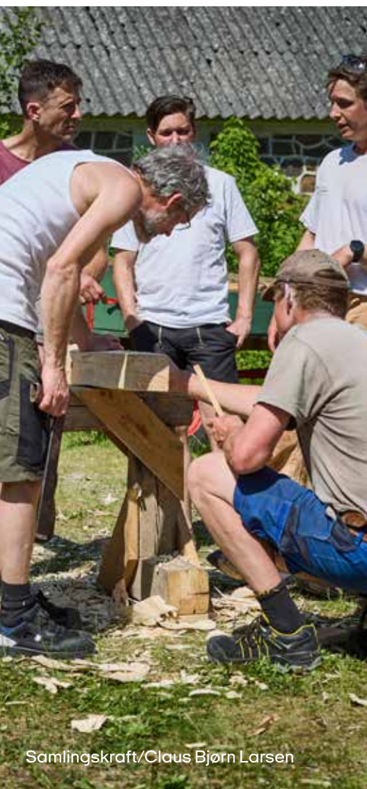
Samlingskraft/Claus Bjørn Larsen

Arkitekturen kan bidrage til at løfte både de større opgaver i samfundet og at understøtte livskvaliteten i det nære og dagligdags. Det gælder også, når vi mennesker i perioder eller som et livsvilkår befinder os i en sårbar situation og har særlige behov. For arkitektur spiller en central rolle i vores sanseoplevelser, adfærd, sociale samvær og for vores sundhed. Men udfordringen er, at vi ikke altid har blik for de muligheder, arkitekturen giver os. Og hvordan den påvirker os.