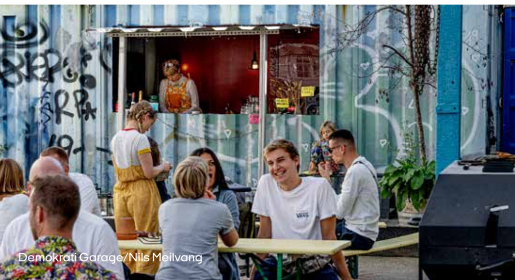
Demokrati Garage/Nils Meilvang