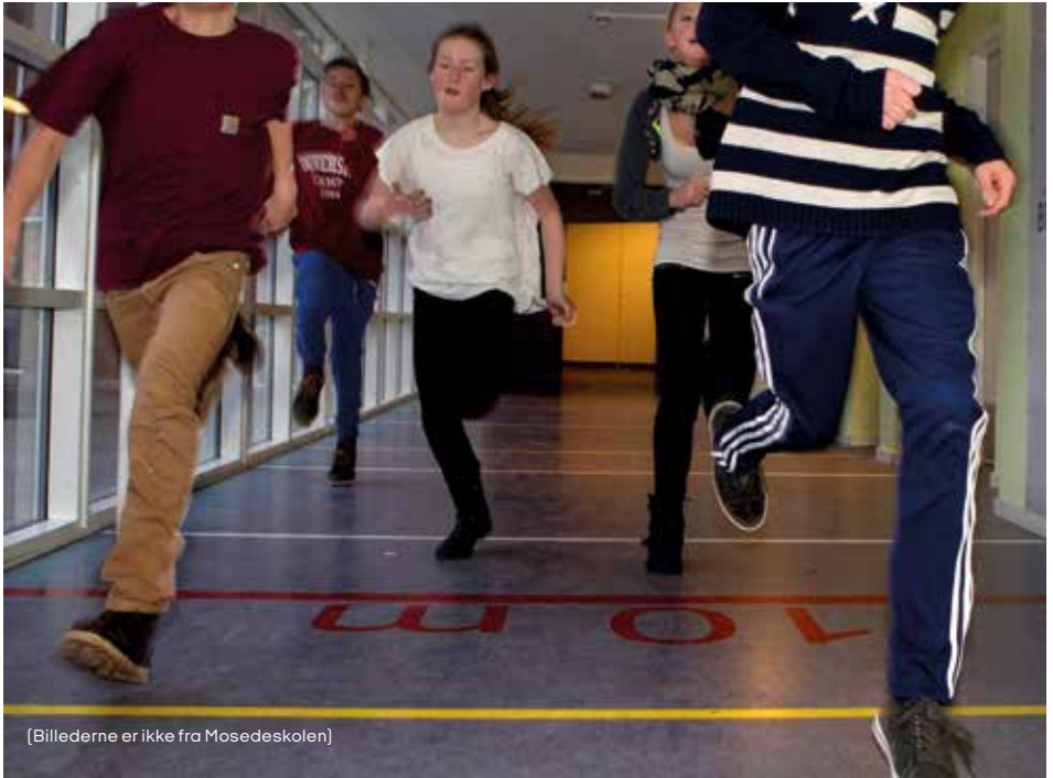
[Billederne er ikke fra Mosedeskolen]