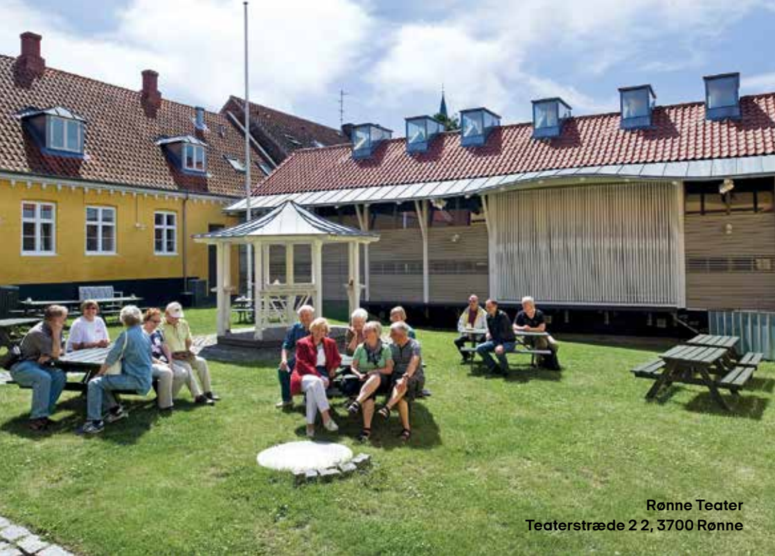
Rønne Teater Teaterstræde 2 2, 3700 Rønne