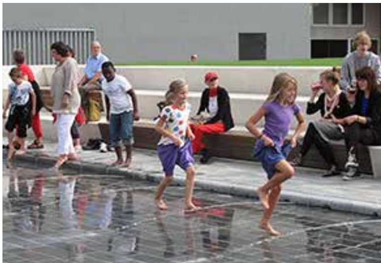
HOLSTEBRO OPSTOD VED STORÅ, OG VED EN MINDRE ATTRAKTIV DEL AF ÅEN ER DER NU PLADS TIL LEG.

hvor forfaldet var sat ind i en grad, som krævede en særlig indsats, hvis ikke stedets helt unikke værdier skulle gå tabt for altid. Visionen var at udvikle det historisk værdifulde kulturmiljø og skabe et regionalt fyrtårn for både kultur- og erhvervslivet.