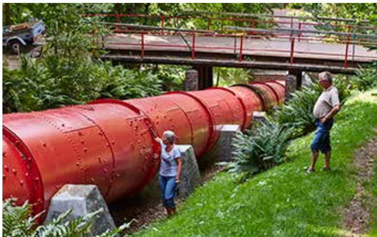
6000 LITER VAND I SEKUNDET LØBER DER IGENNEM DET 80 M LANGE TRYKRØR VED HARTEVÆRKET VED KOLDING.

koncerter, udstillingsrummet Nicolai Kunst & Design med tilhørende værksted og Nicolai for Børn – Danmarks første børnekulturhus. Meget af livet foregår også mellem bygningerne. I det byrum, der er skabt, og som er forbundet med skolegården. I gården har der været velbesøgte markeder, sceneoptrædener, byhaver og meget andet. Og i bygning 5, Koldings nye kulturhus, som det hedder, er der skabt plads til kultur-entreprenører, kulturaktører, iværksættere og kreative tiltag.